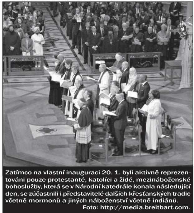
Zatímco na vlastní inauguraci 20. 1. byli aktivně reprezentováni pouze protestanté, katolíci a židé, mezináboženské bohoslužby, která se v Národní katedrále konala následující den, se zúčastnili i představitelé dalších křesťanských tradic včetně mormonů a jiných náboženství včetně indiánů.

Když ve svém nominačním projevu Trump vyjmenovával skupiny, na něž se obrací, jako poslední zmínil evangelikální komunitu a poděkoval jim za jejich „úchvatnou podporu“, kterou si snad ani nezasloužil, ale bez ní by nedokázal zvítězit. A věděl, co říká. Evangelikálové, byť zdaleka ne jednomyslně, vyslali do klání o Bílý dům muže, který nebyl jedním z nich, ale který je dokázal přesvědčit, že bude kromě povznášení Ameriky v ekonomické oblasti hájit právě jejich práva a požadavky – konkrétně např. tím, že v Nejvyšším soudu posílí hlasy zastánců nenarozeného života. Pro ty, kteří mu nadále nedůvěřovali, si pak jako svého společníka, kandidáta na viceprezidenta, vybral Mikea Penceho, který je svým vystupováním i názory přímo ztělesněním konzervativního republikána i křesťana – sám se označuje za born again katolíka. Ten týden po inauguraci spolu s Trumpovou poradkyní katoličkou Kellyanne Conwayovou promluvil na tra-