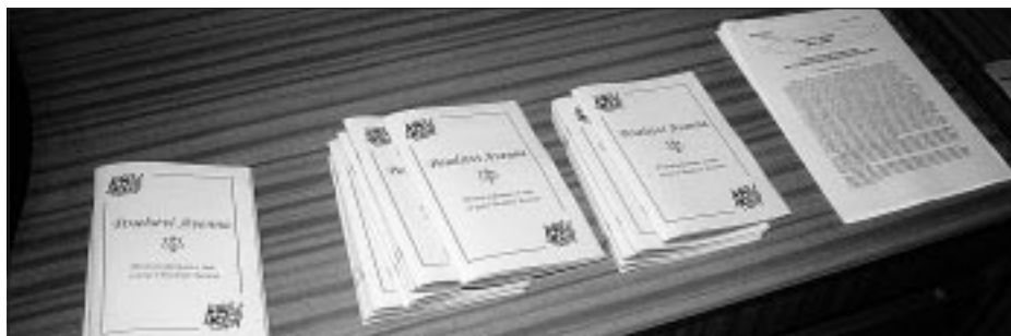
Paní Přádová a Kuňová trvají na tom, že rozhovory poskytnou a fotografování dovolí jen „Spravedlivým“ médiím. Ovšem v dnešní době žádné „Spravedlivé“ médium neexistuje. Fotograf se tedy musí spokojit s nabídkou literatury v předzáří.

Obě jsou přibližně stejně staré (32, resp. 33 let), obě mají zkušenost rozpadu manželství a samostatné výchovy dětí. Obě udávají, že od dětství měly zážitky s čímsi nadpřirozeným, obě inklinovaly k alternativní medicíně a alternativním duchovním směrům. Obě mají soukromou poradenskou praxi a po vzájemném kontaktu v roce 1995 si uvědomily, že obě nesou dvě části Poselství