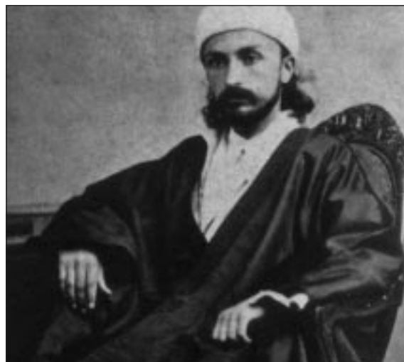
Abdulbahá' jako mladý muž.

Tyto - jistě chvályhodné ideje - však v praxi dělají dojem spíše zbožných přání nebo reklamních sloganů. Nikde jsem se v baháistických spisech ani projevech nesetkal s konkrétní radou, jak těchto cílů dosáhnout. Abdulbahá' např. říká: Majitelé pozemků, dolů a továren se mají dělit o své příjmy se zaměstnanci, dát značné procento svých zisků dělníkům, aby se spolu podíleli na ziscích a byli více motivováni k práci. Bohatí se mají zříkat svého majetku dobrovolně, ve jménu lásky a odd-