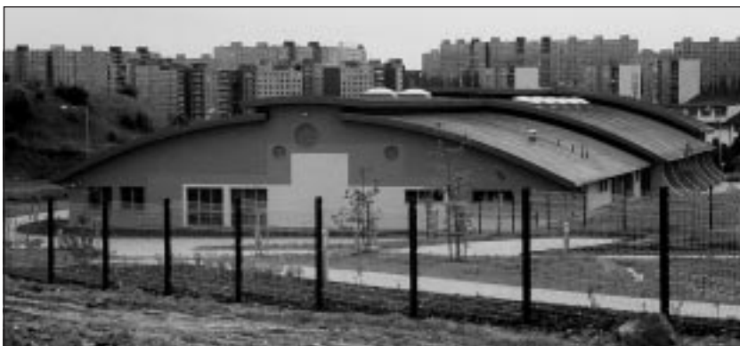
Moderní a výstavní školící středisko vybuodovala firma EuroSymp Center, a. s., v pražských Jinonicích pro Náboženskou společnost Svědkové Jehovovi. Kapacita bezbariérového sálu je 928 míst.

Společnost pro studium sekt a nových náboženských směrů , Jankovcova 31, 170 00 Praha 7, hodiny pro veřejnost: čtvrtek 15,30 - 17,30, tel/fax: (02) 8387 2222, e-mail: sssnns@volny.cz, internet: www.sekty.cz; pobočka Brno , Gorkého 2, 602 00, hodiny pro veřejnost: každé 1. a 3. pondělí v měsíci 16,00 - 18,00, tel: (05) 4124 8780, e-mail: sssnns.brno@post.cz; Poradna o náboženských sektách , HTF UK, Pacovská 350/4, 140 00 Praha 4, tel.: (02) 433 386, linka 37. Občanská poradna Jihlava , Palackého 50, Jihlava, úřední hodiny: čt 15,00 - 17,00, tel.: (066) 733 0164 nebo (0604) 928 733, e-mail: poradcx@centrum.cz.