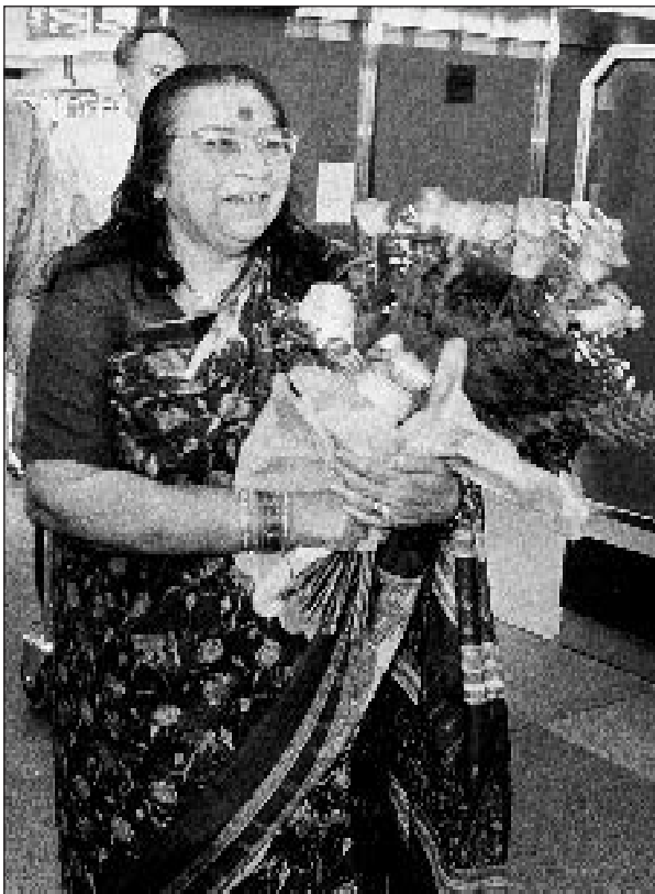
Šrí Matádží v Praze v druhé polovině 90. let.

„Stále vidíte kolem sebe mnoho věcí, které přetrvávají. Lidé si například hledají v sahadža józe své životní partnery. To není dovoleno. Vy nemáte kazit své ašrámy a používat je jako seznamovací kancelář. ... To je jedna věc, kterou byste neměli nikdy dělat, pro všechny účely jste bratři a sestry. Proto vždycky podporují svatby mezi lidmi z různých zemí a z různých středisek.“ 4