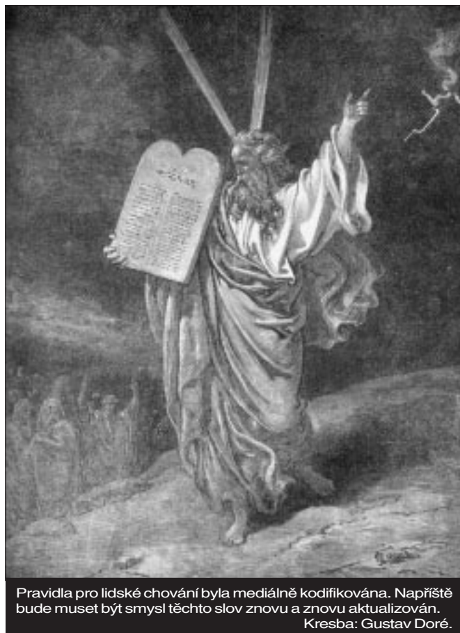
Pravidla pro lidské chování byla mediálně kodifikována. Napříště bude muset být smysl těchto slov znovu a znovu aktualizován. Kresba: Gustav Doré.

Není náhodou, že kategorii profesionálně spirituálně laděných manipulátorů, kteří