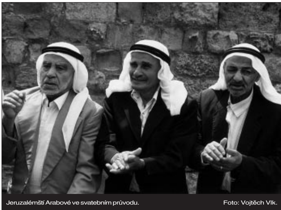
Jeruzalémští Arabové ve svatebním průvodu.