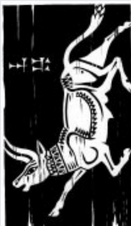
Nebeský býk na ilustraci Veroniky Tydlitátové ke knize Gilgameš.