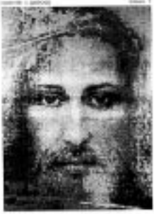
Obálka časopisu, jehož názvem se Děti nejsvětějšího srdce Ježíšova hlásí ke zvěsti prorokyně Vassuly. Také Ježíšův portrét podle tzv. turínského plátna zařazuje Děti ke konzervativním katolickým kruhům, které považují tuto podobu za skutečnou.

vyhodili, které už nikdo nechce. Takoví končí v našem domě.