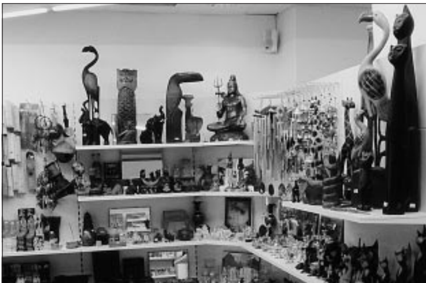
Stoupenci indického duchovního učitele Šrí Činmoje otevřeli v Praze další prodejnu sítě Madal Bal s náradím, domácími potřebami a dárky.