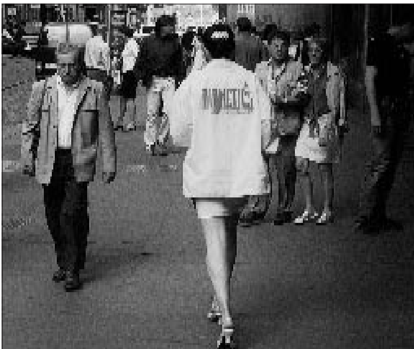
Oxfordské testy schopností (dříve: Oxfordské testy osobnosti) nabízí nyní pracovníce pražského Dianetického centra i chodcům na ulici.