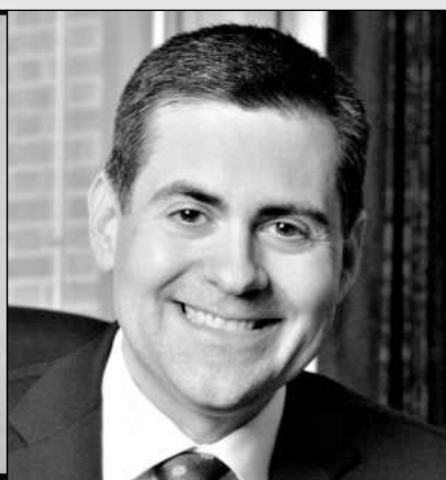
Proti genderové výchově vystupují konzervativní křesťané v různých západních zemích. V USA v současné době budí rozruch zavádění tzv. transgenderových záchodů (kdy si každý volí, které toalety chce využívat) na školách. Baptistický teolog Russell Moore (na snímku) v této souvislosti hovoří o nebezpečné ideologii urážející biblické chápání božího stvoření a vnášející do dětských myslí zmatek.

Připravil Miloš Mrázek podle „WorldWide Religious News“ s přihlédnutím k dalším zdrojům.