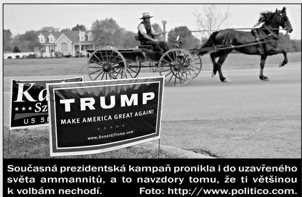
Současná prezidentská kampaň pronikla i do uzavřeného světa ammannitů, a to navzdory tomu, že ti většinou k volbám nechodí.

Populace v ammannitských komunitách (amiš) se za posledních pět let rozrostla o 18 % a podle Centra pro anabaptistická a pietistická studia při Elizabethtown College v Pensylvánii čítá nyní 308 tisíc. V minulém roce se komunity rozšířily do nových sídel v Bolívii a Argentíně. Stoupenci této novokřtěněcké denominace tradičně žijí pouze v USA (především ve státech Ohio, Pensylvánie a Indiana) a ve třech kanadských provinciích a nejsou misijně aktivní. Mladí ammannité mají navíc povinnost odejít z komunity na zkušební dobu a pak se dobrovolně rozhodnout, zda přijmou křest, anebo zůstanou mimo společenství. Pro náročná pravidla komunitního života je přitom typické to, že ammannité odmítají veškeré vymoženosti moderní společnosti včetně elektřiny a automobilů. Ammannitské rodiny jsou často velmi početné – na jednu ženu připadá 6,8 dítěte. Do Jižní Ameriky se ammannité nyní rozšířili proto, aby vytvořili komunity pro místní mennonity, kteří projeví zájem o přičlenění k ammannitům, s nimiž je pojí podobná víra i způsob života.