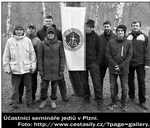
Účastníci semináře jediů v Plzni.

Dalším bodem programu před společným obědem byl nácvik sebeobrany, při kterém se účastníci mohli seznámit (někteří již počtvrté) se základy stylu Krav Maga. Veškerá praktická cvičení nejsou rozvíjena náhodou (vynecháme-li samozřejmě fakt, že jde o to, jakým praktickým záležitostí se věnují členové, kteří se zrovna účastní semináře), vše má i hlubší náboženský smysl. Podle jediů jsou praktická cvičení 1) velkým pomocníkem v seberozvoji, 2) pomáhají naplňovat praktické studium Akademie a 3) pomáhají Jediům pomáhat ostatním. Pro jedie je v případě cvičení důležitý jak přínos fyzický, tak i duchovní.