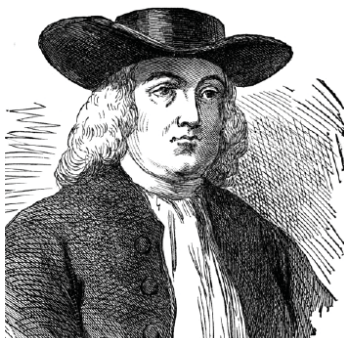
William Penn (1621–1670).