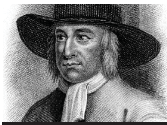
George Fox (1624–1691).

Kvakeři usilují o mír. Snažíme se vést mírovou kampaň ve všech úrovních společnosti, výukou mediace ve školách počínaje a aktivitami za odzbrojování konče. Problematice individuálního násilí se věnují vý-