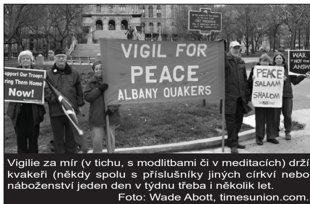
Vigilie za mír (v tichu, s modlitbami či v meditacích) drží kvakeri (někdy spolu s příslušníky jiných církví nebo náboženství jeden den v týdnu třeba i několik let.

Kvakerská kancelář při OSN v Ženevě usiluje o spravedlivý a mírový svět, soustřeďuje se na lidská práva, uprchlíky, odzbrojování, mír, životní prostředí a ekonomické otázky. Organizuje neformální, neoficiální diskuse, kde může každý z účastníků hovořit rovnoprávně a otevře-