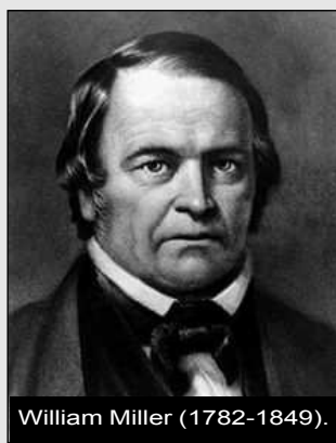
William Miller (1782-1849).

P ocity lidí, kteří i po zklamání věřili, že je Bůh vedl, vyjadřují následující slova Williama Millera: „Kdybych měl prožít svůj život ještě jednou a měl tutéž jistotu, jakou jsem měl, musel bych být stejně čestný k Bohu i lidem... Jsem přesvědčen, že nenesu žádnou vinu za druhé lidi. Myslím, že jsem udělal všechno, co bylo v mých silách, abych nenesl vinu za odsouzení jiných lidí... I když jsem byl dvakrát zklamán, nejsem zklamán a znechucen... Věřím v příchod Ježíše Krista stejně jako dříve. Udělal jsem jen to, co jsem po létech poctivého studia pokládal za svou povinnost. Pokud jsem se mýlil, pak jsem se mýlil ve jménu odpovědnosti vůči Bohu... Jedno vím: Kázal jsem jen to, čemu jsem věřil. Bůh byl se mnou, jeho moc se projevovala v celém hnutí, které přineslo mnoho dobrého... Tisíce lidí začali po kázání o konci času studovat Písmo a skrze víru a krev Ježíše Krista došli smíření s Bohem... Nikdy jsem se neucházel o přízeň pyšných, ani jsem nemalomyslně, když mi svět spílal hrozbami. Ani teď se nebudu ucházet o jejich přízeň. Nikdy nebudu hledat svůj život v jejich rukou, ani, jak doufám, nezaváhám, budu-li jej muset položit, jestliže Bůh ve své laskavé prozřetelnosti rozhodne.“ Bůh neopustil svůj lid. Boží Duch i nadále zůstával s lidmi, kteří zbrkle neodmítli přijaté poznání a neopustili adventní hnutí.